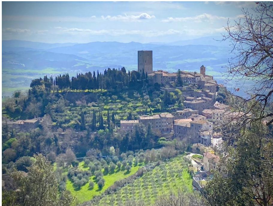
La Torre dei Belforti e centro storico di Montecatini VC