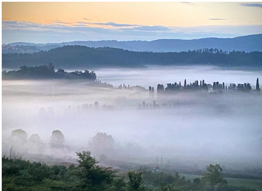
Alba tra Santo Regolo e Lorenzana

Da Parrana SM, attraverso dolci saliscendi - ma senza farci mancare tratti di maggiore impegno- raggiungiamo nell'ordine Lorenzana, il bellissimo punto panoramico della Madonnina de' Monti, Ceppato, Parlascio ed infine Casciana Tme.